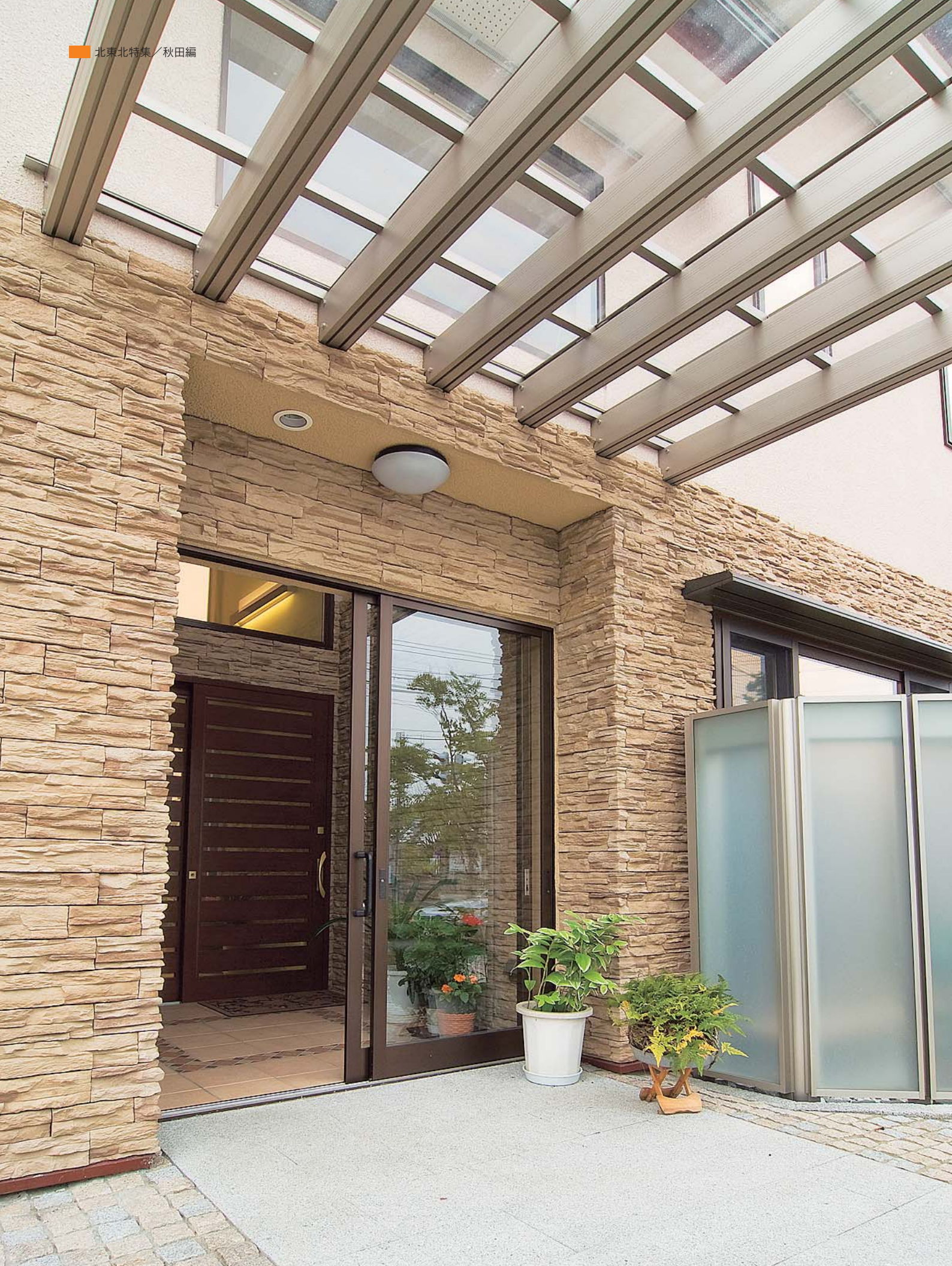
段差のない造りの玄関アプローチ。建物に組み込んだ風除室から玄関へと続く。外装のアクセントはアースカラーのタイル。